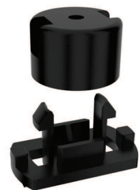
Kit di staffaggio a parete o sospensione

Vite fissaggio tappo zincata DIN 7982C ST2,9x9,5 BN995 - Per Serie Tube