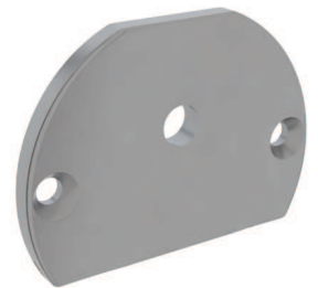
Tappo con foro